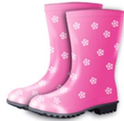
des bottes en caoutchouc